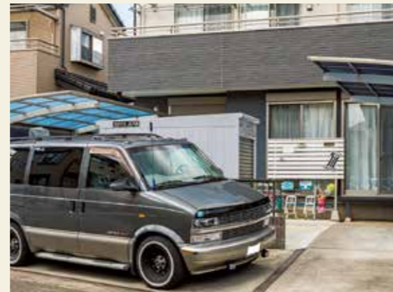
ちなみに道路側から見ると、自家用車の影に隠れてガレージ自体が目立たないよう設置場所や向きを工夫していることが判る。開口部もリビングの窓から見えないため、防犯効果はかなり高い