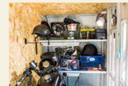
庫内奥には棚板が1枚備わり、簡単なギアや工具を保管可能。棚板はオプションで増設が可能で、2枚にすることで収納量はかなり増える