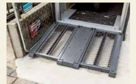
ボックスシェローはシャッター前に盗難防止柵が倒すことでスロープになる仕組み。下面にアジャスターが備わるので、若干の傾斜地でも大丈夫